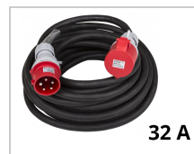
Elektrische kabel 32A