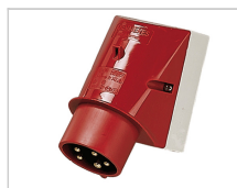
32A Elektrische aansluiting